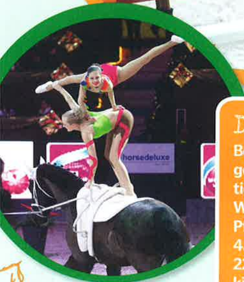
Das Voltigierpferd galoppiert ruhig an einem Seil